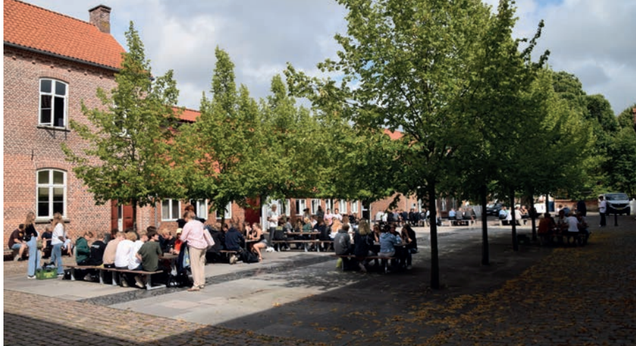
Første fredagsbar foregik i skolegården.

Heimdal se om de stadig kunne stable en fest på benene. De tidligere ledere af Heimdal, der blev færdige på skolen i sommers, måtte tilkaldes, så de kunne rådgive det nye meget uerfarne udvalg. Jeg havde selv fornøjelsen af at være blandt de lærere der havde opsyn med festen, og glæden blandt eleverne, som aftenen skred frem, var mærkbar og stor. Mange 4.g'ere deltog ligeledes i festen, så de også kunne prøve at gå til en gymnasiefest. Bortset fra fester og fredagscafeerne, er næste store sociale tiltag årets musical, som er under forberedelse. For tiden er musiklærerne i gang med at udvælge de heldige elever der skal medvirke til årets musical ("Grease"), ud af et endog meget stort antal elever der har ønsket at deltage. Også her mærker man at eleverne er begejstrede for at være tilbage i hinandens selskab igen. Så helt galt gik det ikke under pandemien.