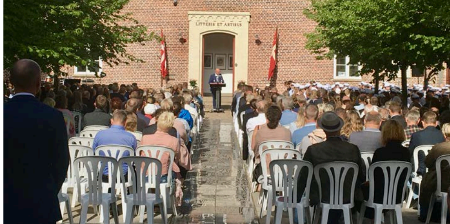
Skolegården var godt fyldt.