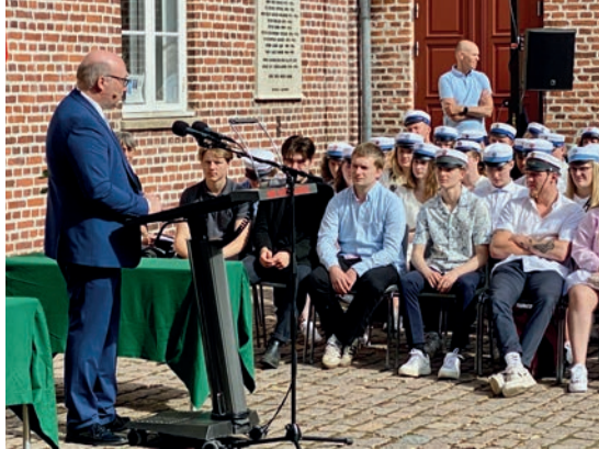
Rektor talte til studenterne

I de forløbne to år har verdens undergang vist sig som en pandemi, der lukkede vores skole i lange perioder. Jeres skolegang har derfor været meget anderledes end for årgangene før jer. Ingen rejser, ingen fester og ingen arrangementer på tværs af klasserne. Et ret isoleret liv bag skærmen. I har taget det ualmindelig flot. I har indordnet jer uden at lade jer underordne. I har fundet vej i et hav af regler og ladet