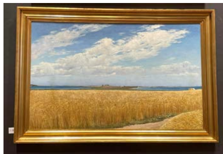
Rings lysende landskabsmaleri fra 1913 er nyeste medlem af Ribe Samlingen.

holde jer opdateret - og vi glæder os sådan til at vise jer det rigtigt.