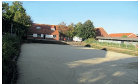
Det ældre apoteks grund

Fra bunden af brøndene har vi udtaget pollenprøver, som vil kunne give et forholdsvist præcist signalement af bevoksningen i området. Vi ved ikke, hvorfor der er så mange brønde under Rosen Allé, men fylden i dem er af forholdsvist ydmyg karakter, og man kan måske forestille sig, at behovet for vandforsyning skyldtes, at der allerede i ældre middelalder har været stalde i området, som husede de mange dyr, som eksporteredes fra byen?