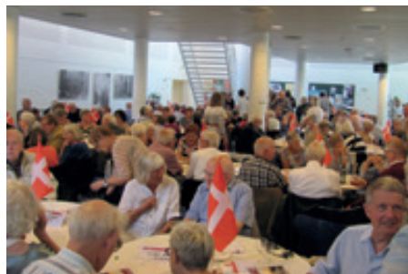
Godt fyldt i salen