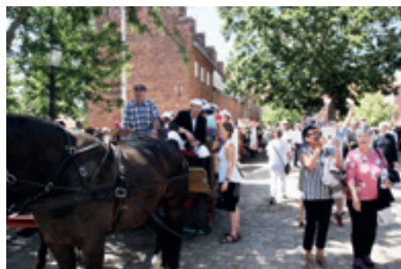
Parat til afgang