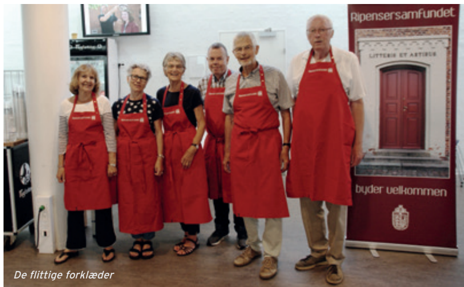
De flittige forklæder

god oplevelse. Vi håber at vores røde forklæder også i år bidrog til den gode stemning!