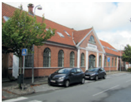
Ribe Jernstøberi begyndte her i 1848