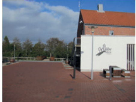
Ribe Byferie og broen til sti over Gl. kirkegård

Forbindelsen er ikke endeligt besluttet idet den overordnede plan for kirkegården er under revision. Men det er let at finde vejen, for de allerede mange brugere har trampet et spor til de nærmeste eksisterende gange på kirkegården.