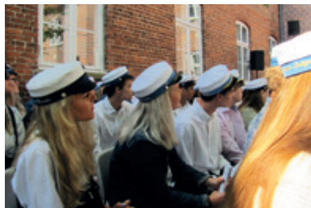
Ja vi er glade for tiden på Katedralskolen