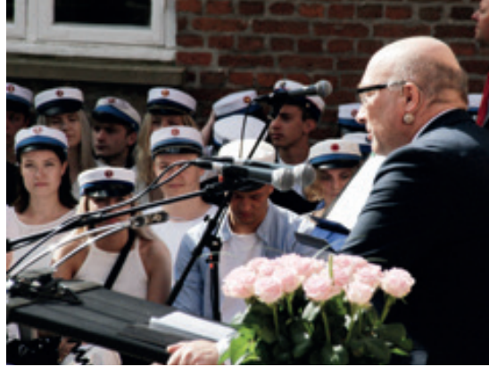
Rektor taler til studenterne

Det er alt sammen begivenheder der ligger som en understrøm af usikkerhed i den enkeltes liv og som er med til at skabe en