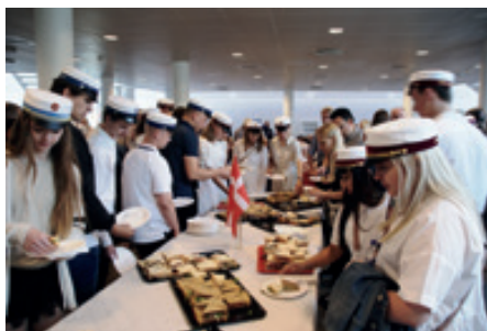
Vi må hellere gardere