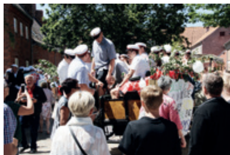
Pladsen var trang