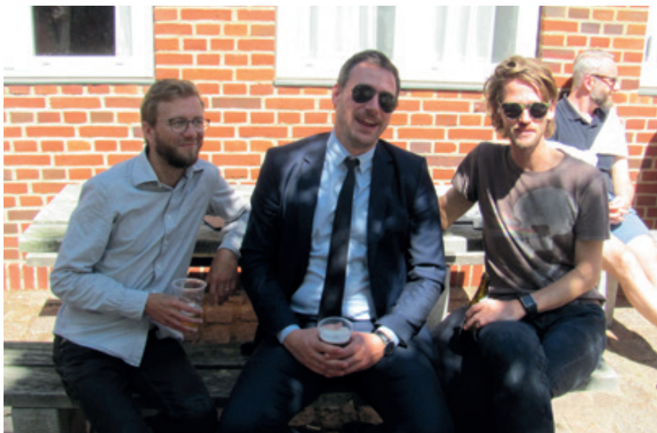
De yngste jubilarer