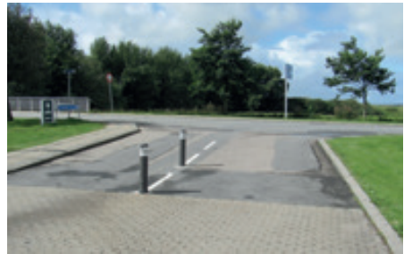
”Pullerter i viser vej”

Det viste sig efter ret få dage, at det bare ikke var sikkert, at der var pladser, når man nåede frem. Noget var glippet. Derfor blev der slukket for skiltene, og man måtte klare sig selv. Man fandt ud af at mange biler ikke blev registreret korrekt som ind- eller ud kørende bl.a. fordi folk kunne køre uden om følerne eller over de forkerter. Det har man nu rodet med i lang tid og sat pullerter op så der køres ind og ud på rigtig måde og der er lagt supplerende følere. Genåbning er er sket på en enkelt af pladserne, og alle håber systemet nu kommer til at fungere. Turiststrømmene er ved at aftage, så der bliver god tid til at vurdere på om alt fungerer efter hensigterne.