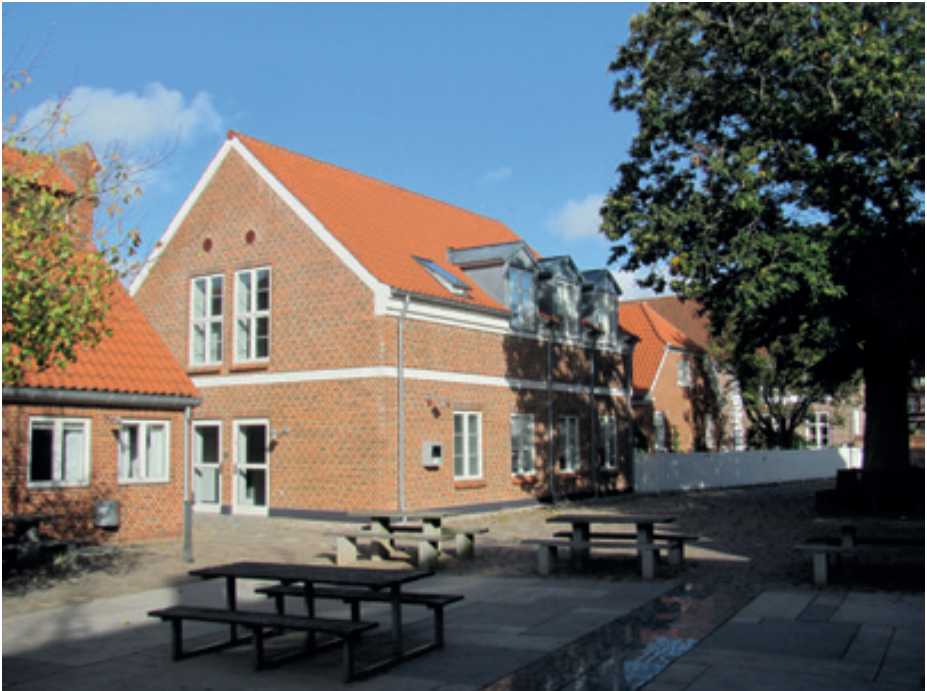
Den nye bygning i pedellens have