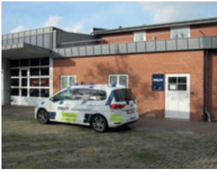
Ribes beskedne politistation

Med hensyn til indbrud i boliger og forretninger har vi i Ribe ikke noget at klage over med hensyn til hurtig reaktion fra Politiets side. Redaktøren var i august ude for et tyveri af en designer lampe fra et gadevendt vindue. Et kvarter efter anmeldelsen stod to betjente ved vores bolig! Tyven blev senere fundet og straffet, men lampen er væk!