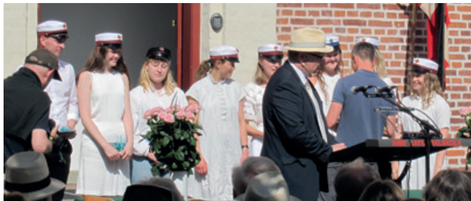
Der var mange dygtige elever

Fra 1. februar blev skolens kantine lagt i hænderne på Porsborgs. Det har været et meget glædeligt bekendtskab med nogle ambitiøse unge kokke, der fra dag et meldte at deres ambition er at lave Danmarks bedste og sundeste skolekantine. Man lærer nu engang bedst, hvis det ikke er på tom mave.