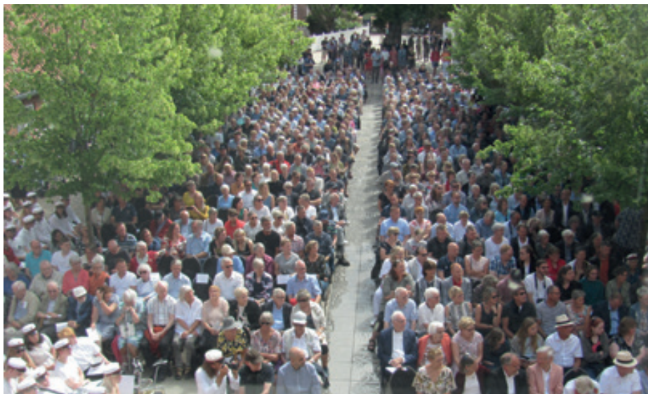
Jubilarer og pårørende fyldte godt op i skolegården

Bestyrelsen takker for godt samvirke med skolen og alle deltagere.