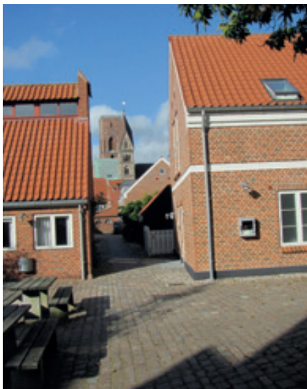
Rebsslagergangen og Domkirken

Lige før folketingsvalget havde vi vælgermøde, hvor langt de fleste partier var repræsenterede og alle førstegangsvælgere fik en god introduktion til hvor stor en taleyst der kendetegner de fleste politikere og hvor svært det er at få et ordentligt svar på sine spørgsmål.