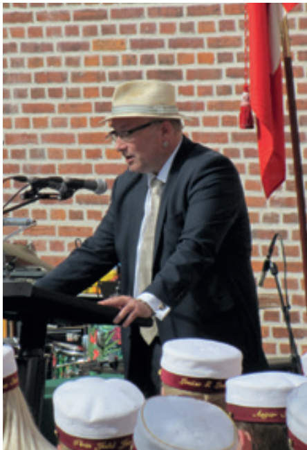
Rektor bød velkommen i solhat

Endelig nævnte rektor, at der blandt jubilarerne var to realister fra 1939 og to studenter fra 1944, tre studenter fra 1949 samt ca. 15 studenter og realister fra 1954. Herudover var der snesevis af øvrige jubilarer.