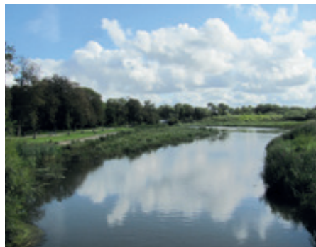
Mølledammen set fra Dagmarbroen

Der gik ikke mere end et par år før Mølledammen igen begyndte at blive lodden om sommeren og det har som følge af den ophørte grødeskæring udviklet sig, så der nu i denne sommer har udviklet sig et ret tæt plantedække med frit å-løb i midten.