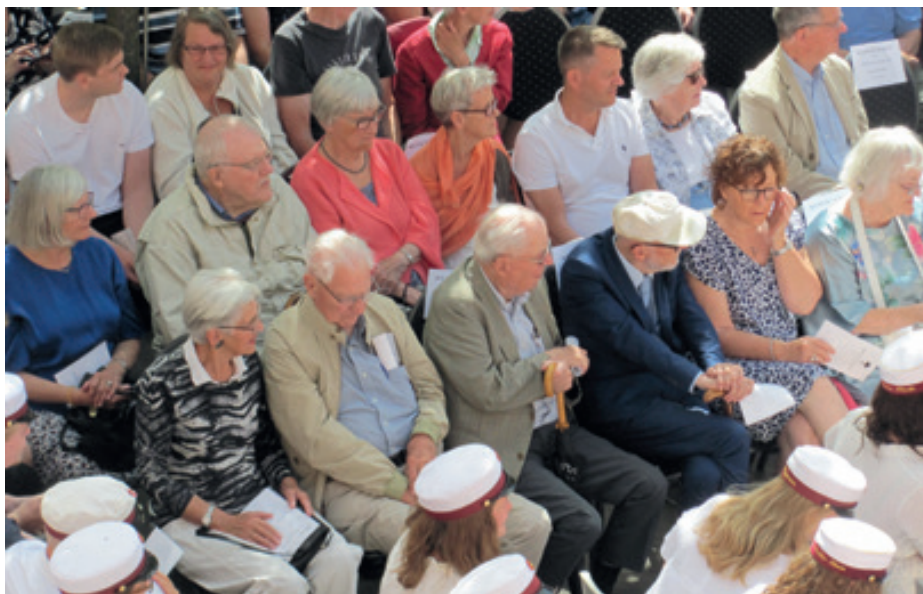
De ældste jubilarer på de reserverede pladser