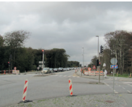
Der er gået hul i Plantagen! og Her ses begyndelsen til sti-underføringen

Arbejderne påvirker trafikafviklingen, men det er dog ikke de helt store gener der er tale om hidtil.