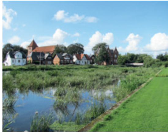
Mølledammen set fra Vedels Anlæg

Om projektet ville have kunnet forbedre forholdene i Mølledammen er måske tvivlsomt, men det ville have givet en lidt højere sommervandstand og dermed bedre mulighed for at holde sivvæksterne i ave, når man beslutter sig for at genoptage grødeskæringen!