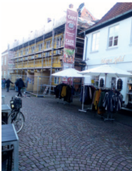
Quedens Gård pakket ind