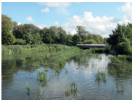
Mølleedammen set fra Andeø broen fra Badstuegade

■ Udvidelsen af hovedvej A 11 er et andet projekt som har optaget sindene i Ribe i lange tider. Selve anlægsarbejdet gik i gang i maj måned, så de af jer der var til Jubilareception mv. i slutningen af juni har set det forberedende arbejde.