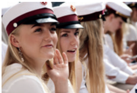
Vi er også glade