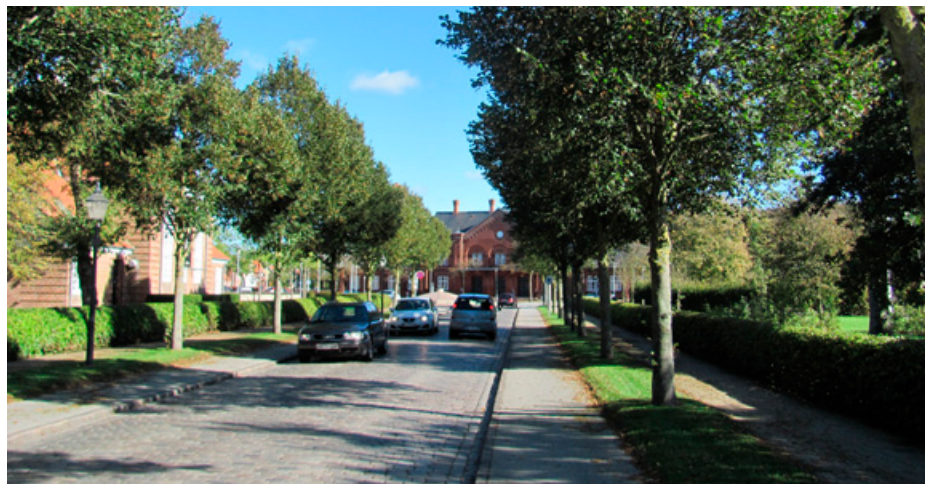
Dagmarsgade med banegården i baggrunden

■ Ribe Madstation i den gamle banegårdsbygning er godt på vej. En række lokale producenter bakker op om projektet. De kommer fra området fra Ho Bugt i nord til egnene syd for Skærbæk.