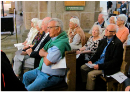
De ældste jubilarer i Domkirken. I front

Der var i år ud over de foran nævnte 75 og 70 års jubilarer, deltagelse af fem 65 års jubilarer. Det var studenterholdet fra 1952. Desuden var seks studenter fra hold 1951, som i 1950'erne og 1960'erne var drivende kræfter i genrejsningen af Ripensersamfundet efter anden verdenskrig, mødt frem.