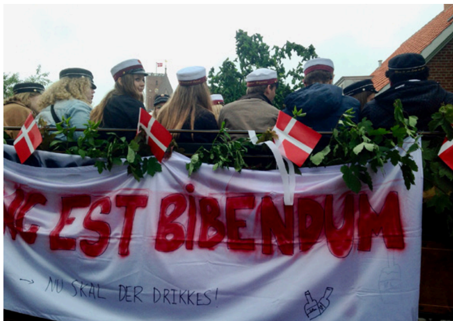
Her er vist et par latinere i blandt