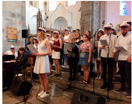
En af de fem "brødre"

Der blev i øvrigt holdt alle de sædvanlige taler, som kan læses i deres helhed i det følgende.