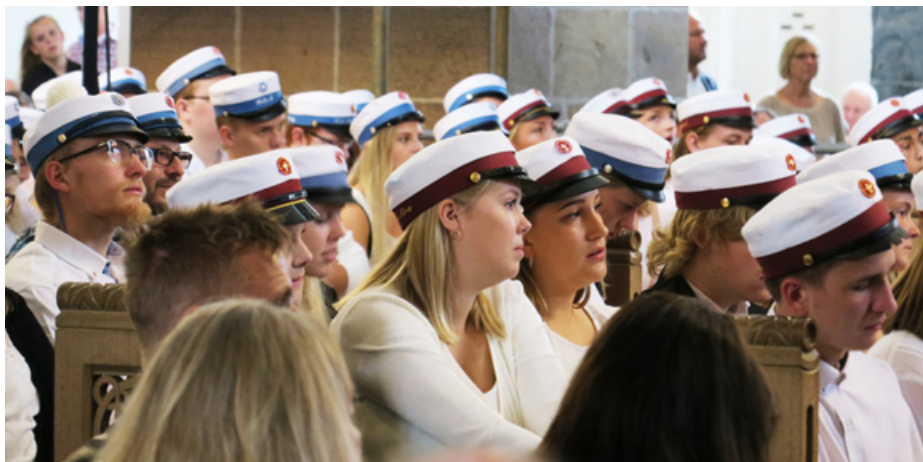
Vi blandede os også undervejs

Alle vi der sidder her har noget tilfælles – vi har nået vores mål.