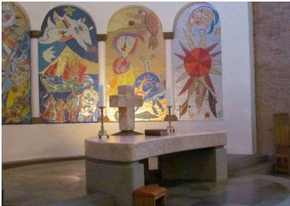
Carl Henning Pedersens mosaikker lyste op

Sidste weekend mødtes 5.000 mennesker fra hele verden til international dragefestival på Fanø. Luften var fyldt med drager, højt til vejrs, blafrende i vinden. Alle der har prøvet at flyve med drager, kender den lykkelige fornemmelse, når dragen er højt oppe i luften og man har kontrollen via den lange line. At have jordforbindelse via linen er helt nødvendigt for at få dragen til at flyve. Knækker linen falder dragen til jorden. Hvis dragen er symbolet på den