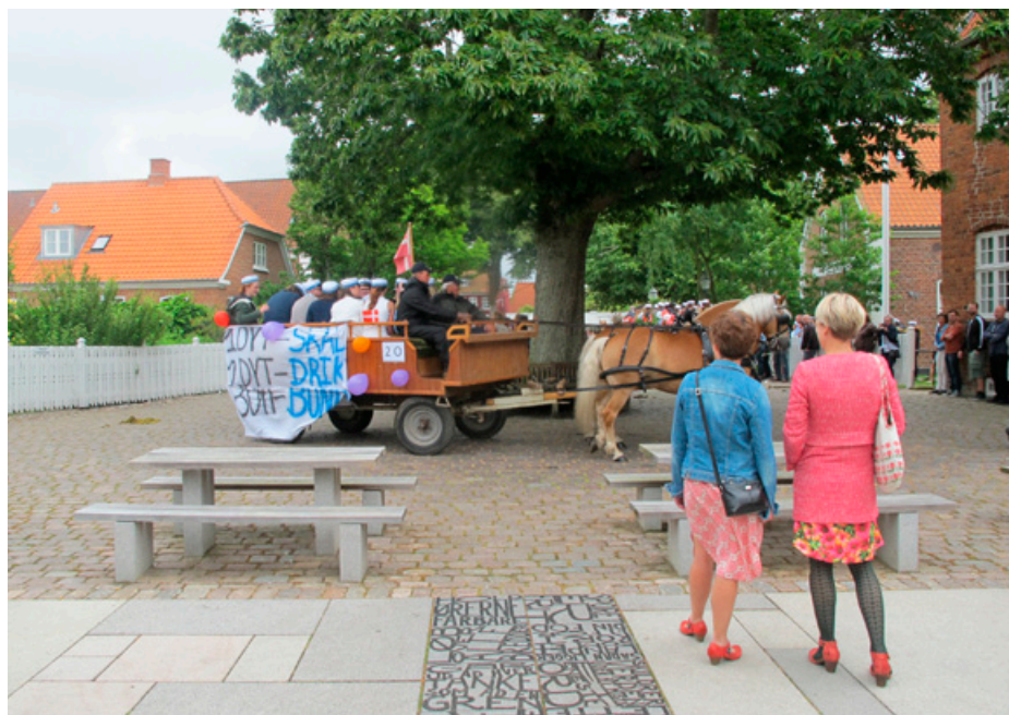
Så er der afgang for hf 2.0