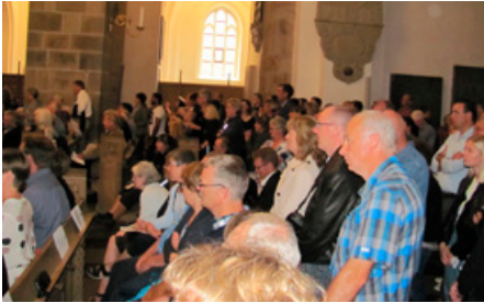
Der var trængsel bagved

den forbindelse vil jeg sige tak til skolens to uddannelsesledere, vores sekretærer og skemalægger. I har i fællesskab håndteret denne situation på bedste vis, således at alle opgaver alligevel er blevet løst.