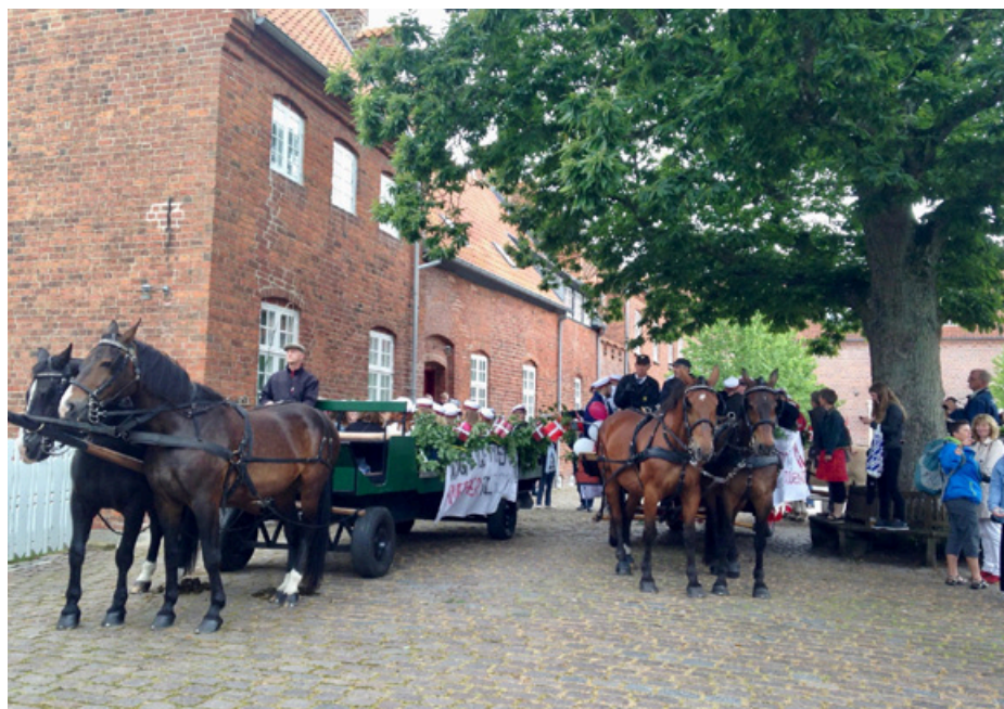
Hestevognene holder sig klar