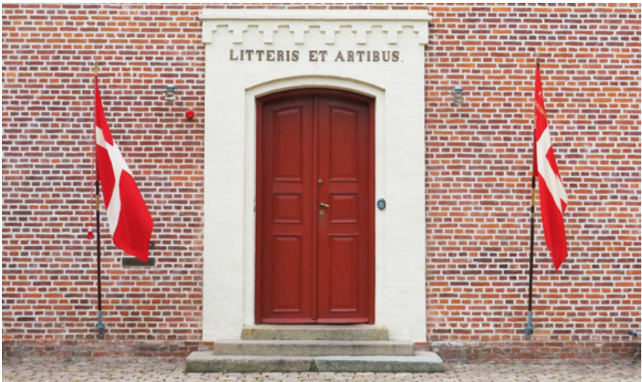
Her kom den nye fane til at stå lidt senere på dagen

vil ønske dig et godt otium og bede dig komme op og modtage en buket.