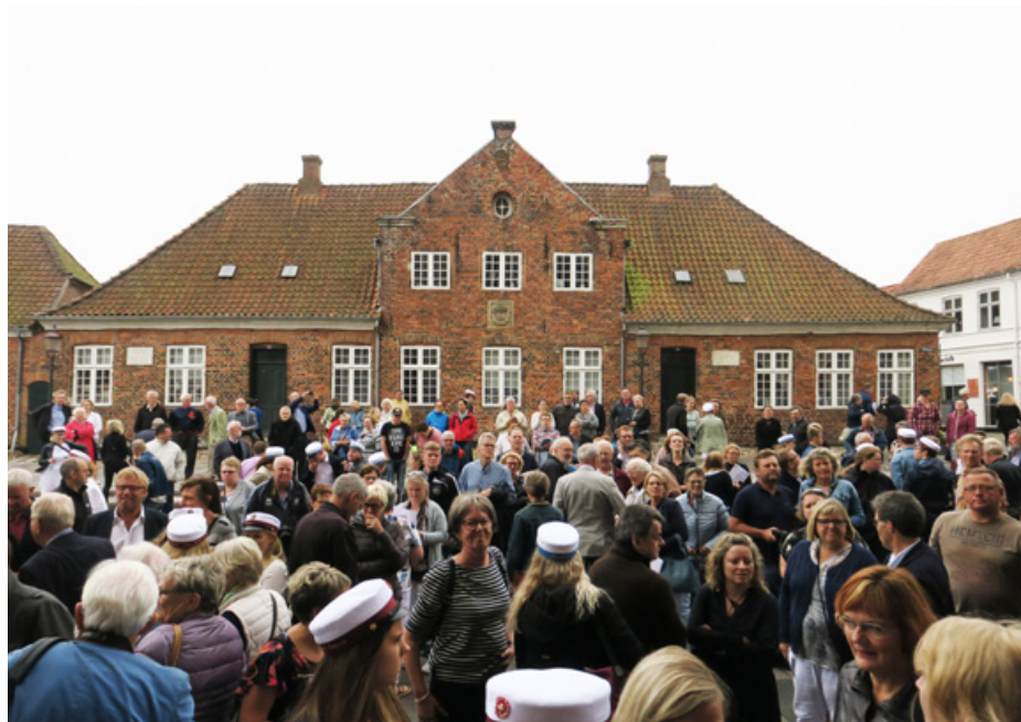
Mylder foran den gamle Katedralskole