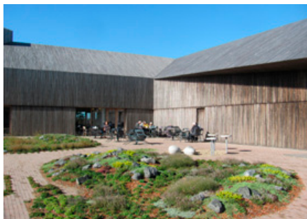
Tundra i den indre gård

Fuglene og deres trækruter er visualiseret på flere måder, herunder med et imponerende forsøg på at skabe illusionen om at stå midt blandt de trækkende fugleflokke. Det skal man give sig lidt tid til.