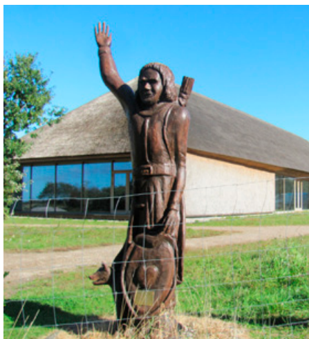
Velkommen til Vadehavscentret siger Orkra, en garvet vadehavshøvding ved vejen fra Mandø Ebbevej

■ Vadehavscentret er kommet rigtig godt videre fra start i dets nye og stærkt forøgede form. Siden åbningen i februar har der været overordentlig mange besøgende. Gæst nr. 100.000 kom den 8. oktober; det var en familie fra Schweiz. Og sæsonen er ikke helt ovre endnu, så man venter at nå ca. 120.000 inden nytår. Den hidtidige rekord var i 1997, da der var 31.000 besøgende. Der kan ikke være tvivl om at mange kommer fordi de har læst begejstrede anmeldelser af udstillingerne og bygningsværket.