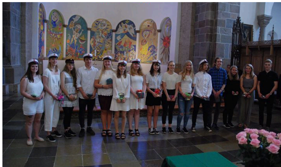
Dygtige elever modtog boggaver