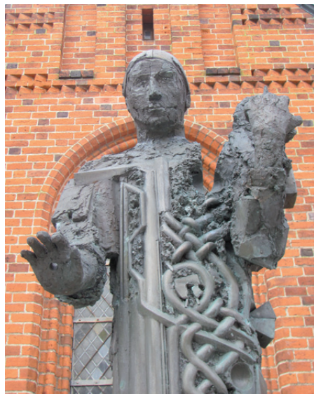
Den spaltede munk.

hans skulptur af Treenigheden afsløret ved bispegården i Nykøbing Falster.