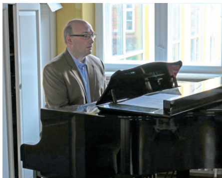
Rektor ved flygelet.

Den seneste bekendtgørelse om det almene gymnasiums formål fastholder et primært sigte mod videregående uddannelse med udvikling af faglig indsigt og studiekompetence. Krav til selvstændighed, samarbejde og sans for at opsøge viden er tillige centrale. Eleverne skal endvidere lære at forholde sig reflekterende og ansvarligt til