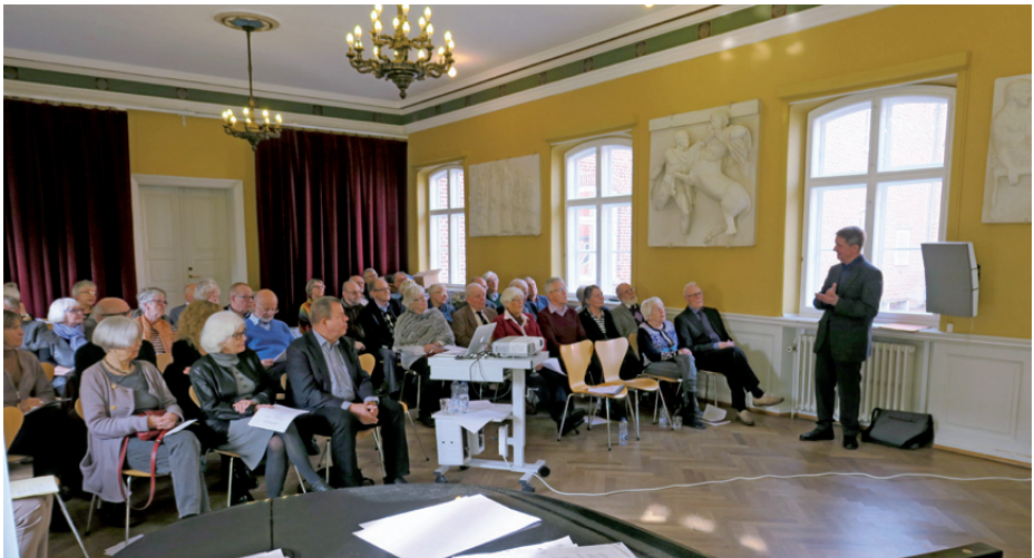
Dirigenten takkede den store forsamling for valget.