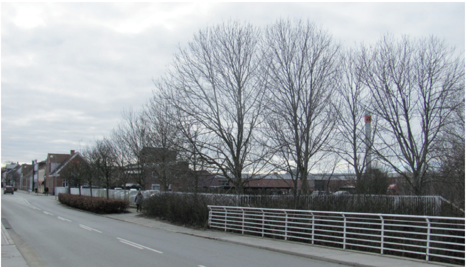
I dag er der træer på »Esso Lassens« hjørne.

Den første februar åbnede Færdselsstyrelsen sin afdeling i Ribe. Statsminister og Trafikminister tog sig tid til at deltage i åbningen! Det foregik som et åbent hus, og flere hundrede ripensere valgte at møde op for at deltage i fejringen. De første 40 medarbejdere er ansat, og der var rigtig mange ansøgere. Ganske mange er fra det sydjyske område. Kun enkelte af de hidtil ansatte i København har valgt at flytte med. Nu forlyder det at de sidste 30 medarbejdere i København har skullet tage stilling til om de ville flytte. Heraf har 18 meddelt at de ikke flytter med, og to har besluttet at flytte med. De sidste 10 er ikke endnu blevet bedt om at beslutte sig, eller de overvejer