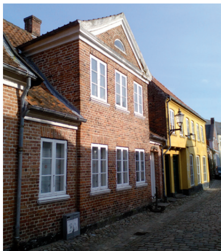
Jacob A Riis barndomshjem.