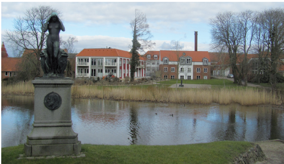
Biografbygningens ti nye boliger er næsten færdige, og Riberhus venter måske.