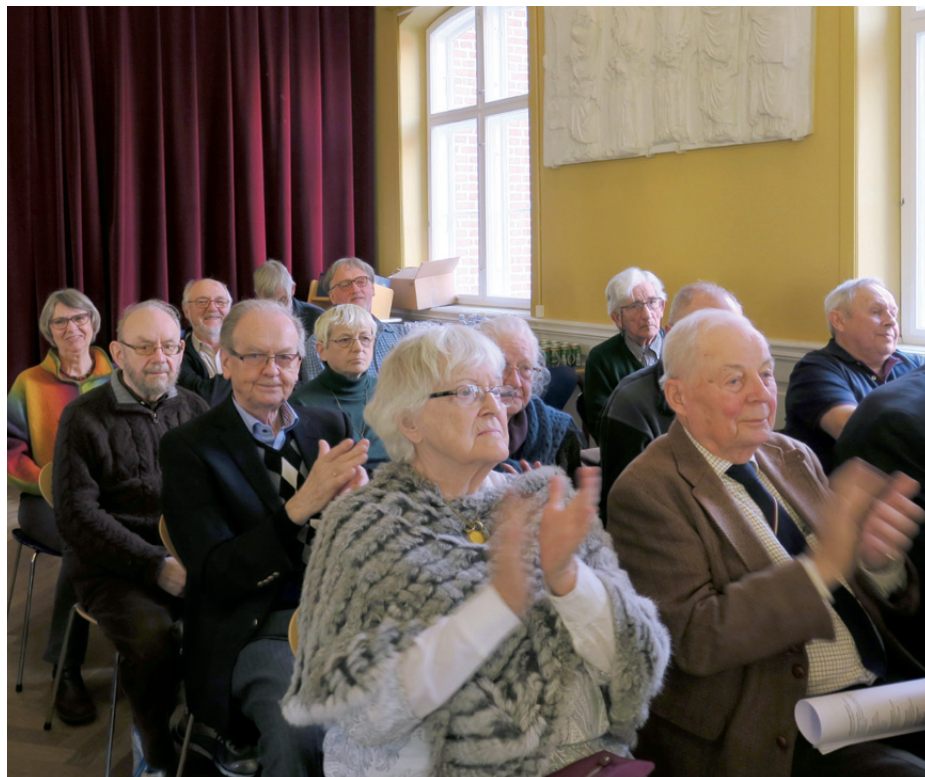
Forsamlingen var tilfredse med beretningen.

at foreningen ikke rigtig appellerer til de unge og sandsynligvis ikke vil gøre det i en tid, hvor al kommunikation foregår elektronisk.