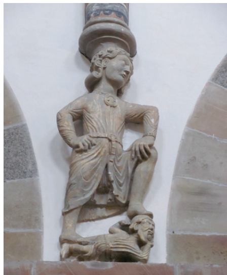
Hvor kom atlas figuren mon fra?

Kirker omkring 1980 forsøgte man at finde ud af om figureerne er tilhugget nede i Rhin området, hvor der i nogle kirker findes helt tilsvarende figurer, eller om de er tilhugget her i Ribe af tilrejsende billedhuggere. Med de dengang brugte analysemetoder kunne man ikke nøjagtigt bestemme sten materialets oprindelses sted. Man har nu langt bedre metoder og håber at finde en løsning på gåden!