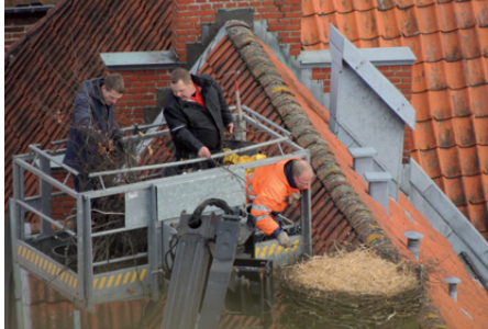
Højt til vejrs med redebyggerne.

endnu. Der bliver altså endnu en mulighed for mere end atten ansøgere udefra.