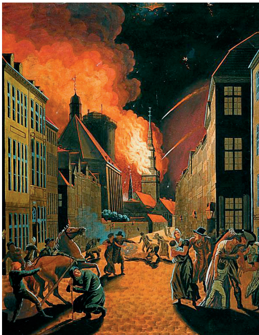
C. W. Eckersberg: Vor Frue Kirkes spir skudt i brand bombardementets tredje nat.

I 1805 besejrede den engelske admiral Nelson i slaget ved Trafalgar Napoleons forenede fransk-spanske flåde. Dette gjorde den danske flåde til den største på det europæiske fastland, hvorfor den var strategisk vigtig for både englænderne og franskmændene. I efteråret 1806 stod Napoleon som sejrherre i Berlin. Det var en vanskelig balancegang for Danmark at bevare neutraliteten. Napoleon havde udsendt en bestemmelse om den såkaldte fastlandsspærring, hvilket var et forsøg på at isolere England handelsmæssigt og dermed økonomisk. I juli 1807 sluttedes der fred mellem Rusland og Frankrig. En af aftalerne gik ud på, at også neutrale lande skulle tvinges med i fastlandsspærringen. Dette gjorde Danmark med den store flåde til en potentiel fjende for England. Derfor forlangte englænderne flåden udleveret; men forhandlingerne herom nåede ikke i mål af forskellige grunde. Englæn-