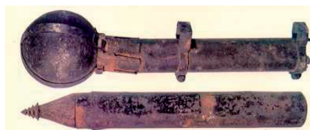
Øverst en raket med en bombe i spidsen. Nederst en af Congreves raketter med modhager i spidsen, så den kunne sætte sig fast, hvor den ramte.

(...) skyndte jeg mig ud Sengen og i Klæderne og at drikke mit Thevand for at gaa