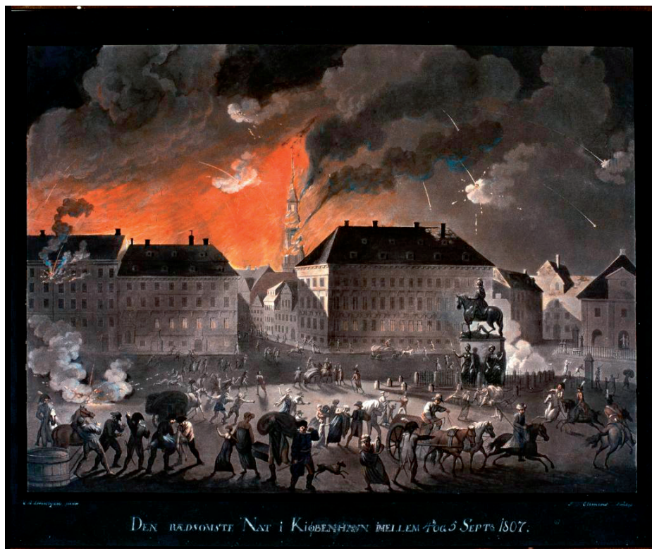
C. A. Lorentzen: Kongens Nytorv mellem d. 4. og 5. september 1807. Statens Museum for Kunst.

ud i Byen og erkyndige mig om Tingenes Tilstand. Her erfarede jeg, at Englænderne vare landsatte, i fuld Anmarsch nærmede sig Staden, samt at Commandoskabet paa højere Ordre opfordrede Studenterne til at gribe til Vaaben, en Opfordring, der klang i mine Øren som en liflig Musik. At jeg uopholdelig ilede til Mødestedet, var blandt en af de første, som blev indskrevet og bevæbnet, og at jeg bevæbnet med Over- og Undergevær forføjede mig hjem, besjælet af krigeriske Tanker, lystende efter Kamp og haabende en heldig og ærefuld Sejr, der forstaas let af den krigeriske Aand, som boede i mig. (...)