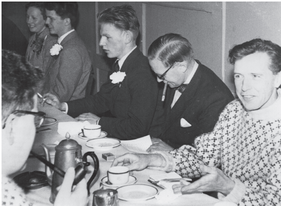
På Skovpavillonen sidste skoledag, 1957.