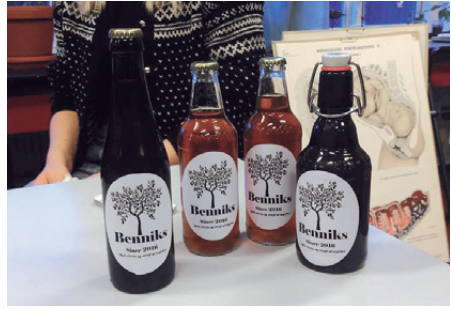
Anvendelsesorienteret undervisning, 2z brygger øl.

Han gennemgik derefter en række statistiske undersøgelser for studenter fra de forskellige gymnasietyper. De viser at en høj procentdel af studenter fra det almene stx gymnasium er i gang med en lang eller mellem-lang uddannelse godt to år efter deres studentereksamen. Der er større spredning