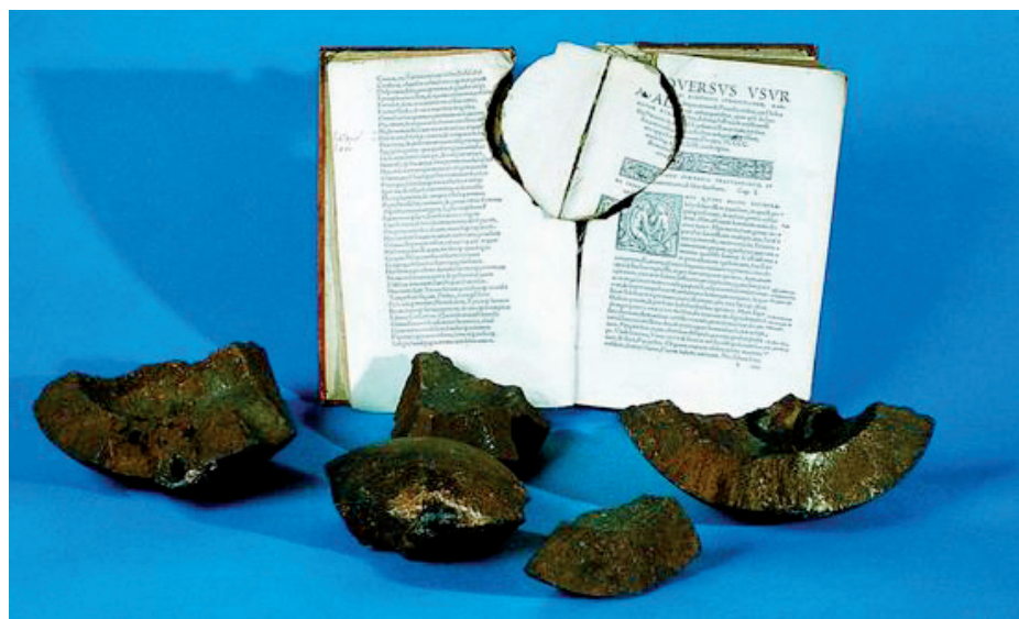
Sprængstykker fra en bombe ødelagde en del bøger på Universitetsbiblioteket blandt andet den viste bog, som ironisk nok hedder »Fredens Forsvarer«.